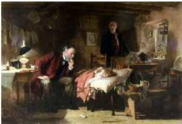
El Doctor de Sir Luke Fildes (1891)

En bastantes ocasiones no se trata de un amor carnal por las limitaciones físicas existentes pero está en las miradas, cómo cogen su mano o qué le cuentan mientras le cambian. Ahí existe el amor. Los pacientes, cuando se encuentran muy deteriorados, pueden no entender que les decimos pero sí perciben el tono que empleamos generando emociones en función de él. Por otro lado es triste ver como pacientes con deterioro cognitivo que presentan trastornos conductuales o delirios no detectados o tratados inadecuadamente rechazan a familiares que les adoran. Esto provoca la desesperación de los cuidadores que no asumen que es una situación secundaria al deterioro sin que ellos sean responsables de la misma.